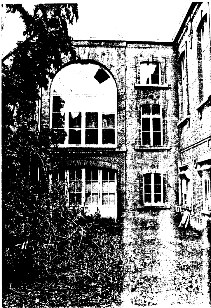
De 19de-eeuwse ziekenzalen van Sint-Jan: eens een voorbeeld van moderne ziekenhuisbouw, thans verlaten en vervallen.