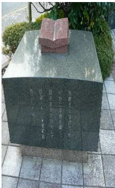
Kaitai Shinsho boek, St Luke's International Hospital, Tokyo